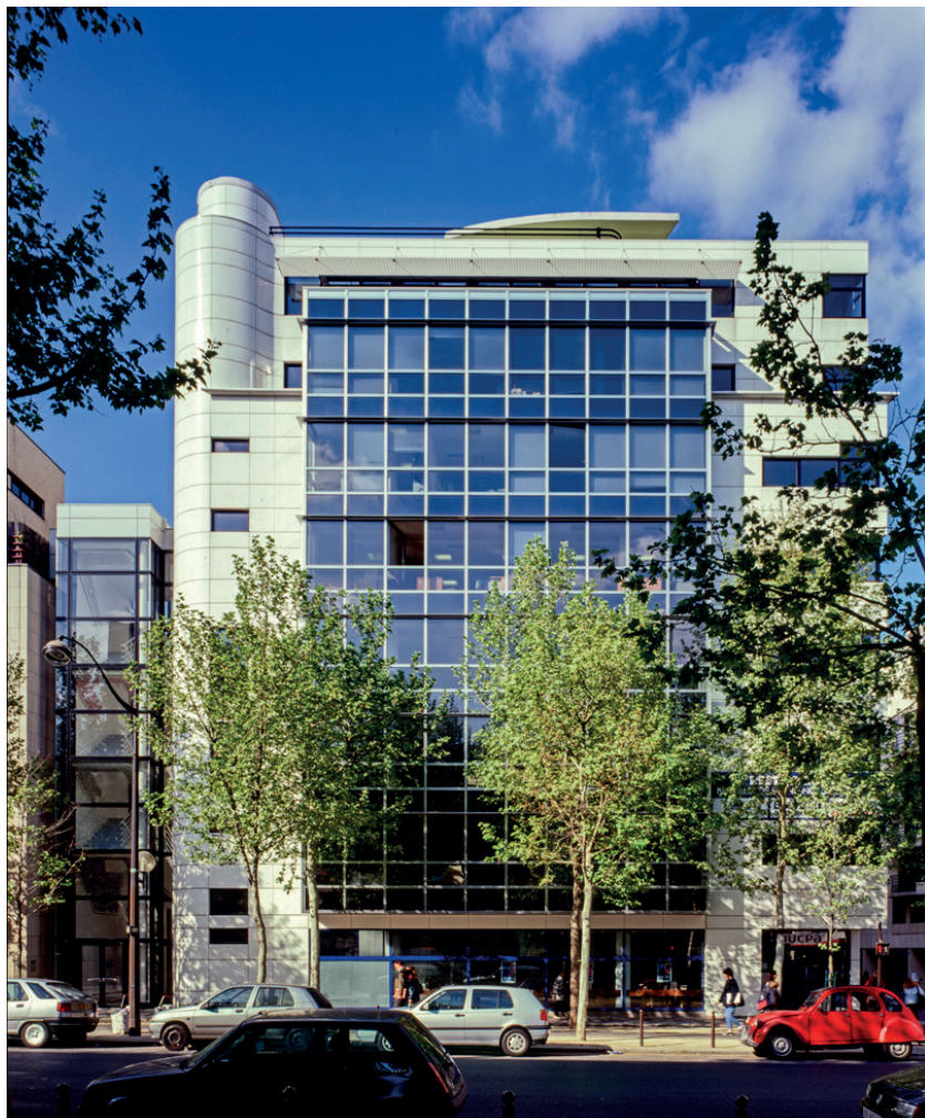
FAÇADE PRINCIPALE SUR LE BOULEVARD

Cet immeuble de bureaux, extension opportuniste d'un ensemble résidentiel de 261 logements réalisé pour le même maître d'ouvrage, illustre le paradoxe de l'architecte confronté avec un décalage de huit années à l'environnement qu'il a lui même mis en place.