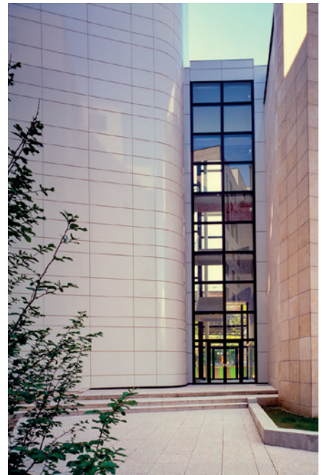
VUE DE LA FAÇADE ARRIÈRE

auvent dévoilant le statut festif de la terrasse haute.