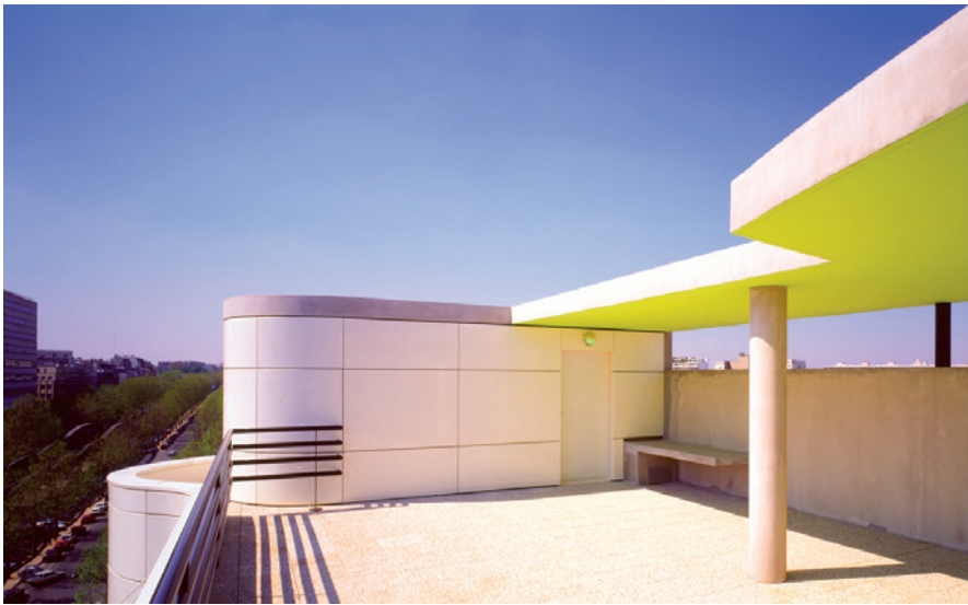
TERRASSE POUR RÉCEPTIONS