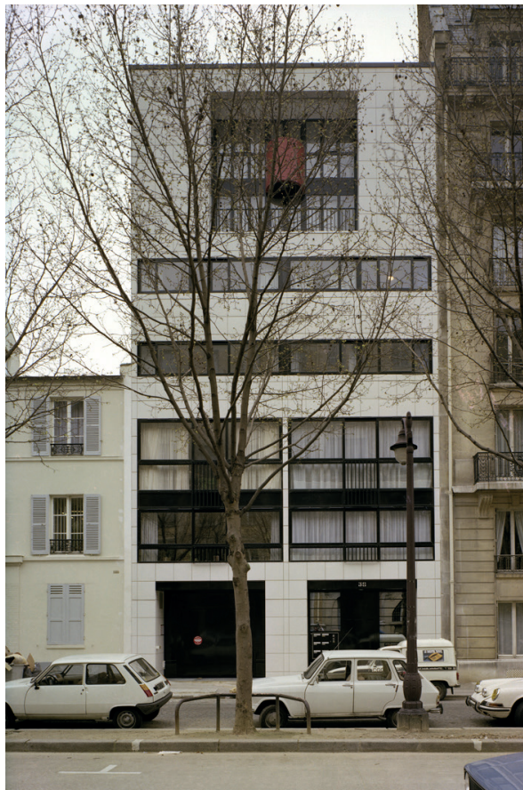
FAÇADE SUR AVENUE DE SAXE

ARCHITECTES: DIDIER MAUFRAS ET HERVÉ DELATOUCHE