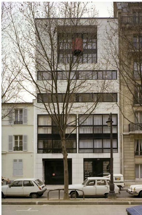
FAÇADE SUR AVENUE DE SAXE

ARCHITECTES: DIDIER MAUFRAS & HERVÉ DELATOUCHE